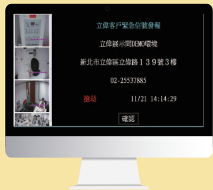
勤務中心-異常觸發畫面