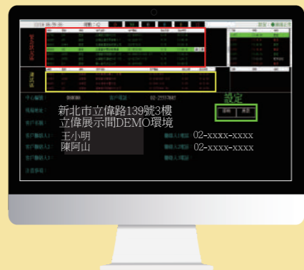
勤務中心-訊號監看畫面